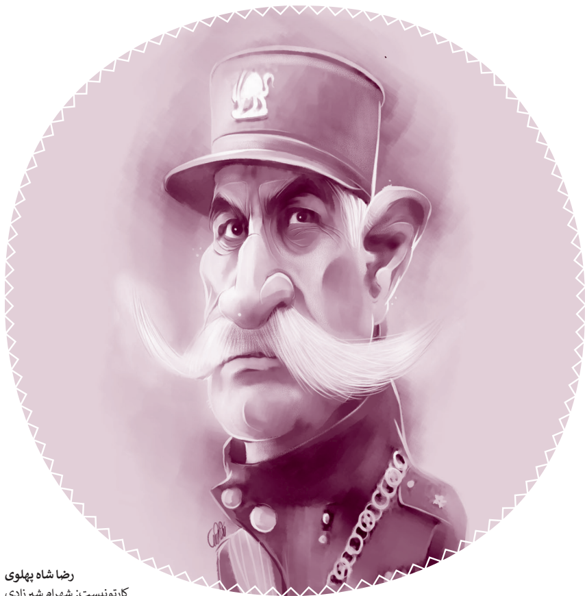
رضا شاه پهلوی کارتونیست: شهرام شیرزادی