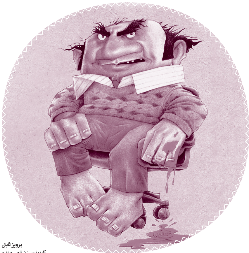
پرویز ثابتي کارٹونیست: ناصر مقدم