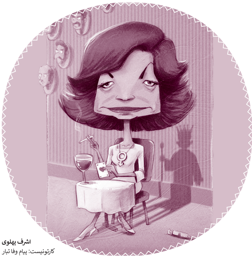
اشرف پهلوی کارتونیست: پیام وفا تبار