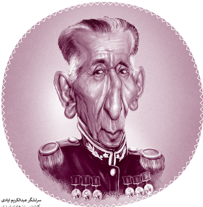
سرلشگر عبدالکریم ایادی کارٹونیست: ہادی اسدی