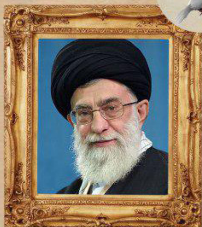
امام خامنه‌ای (مدظله‌العالی):

آن بزرگوار، از یک طرف، مظهر تعبد و تسلیم در مقابل تکلیف الهی و مظهر مجاهدت و شهادت مظلومانه است و از طرف دیگر، مظهر عظمت و شکوه و تنویر افکار عامه ملت اسلام در طول قرن هاست.